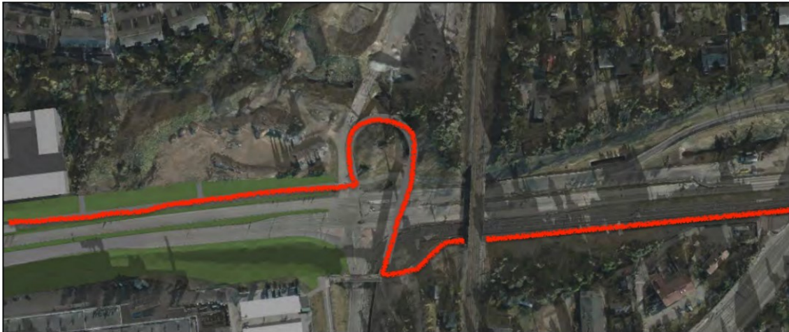
Kuva: Valtavyhlän suuntainen reitti eteläisen sillan kautta

Kaava-alueen ulkopuoliset suunnitelmat: Huonompaan suuntaan suunnitelmissa on kehittynyt erityisesti eteläinen Hervannan valtavyhlän ylittävä silta, josta on tarkempi sijoituskuva katu ympäristösuunnitelmassa. Sen pitäisi olla osa pohjois-eteläsuuntaista pääreittiä! Sen lisäksi, että linjaus on aiempaa pidempi, on sille saatu sijoitettua 120 asteen käänös, jyrkkä 90 asteen käänös heti mäen alla, sekä yhdet liikennevalot lisää , mikä on ilmeisen tarkoitushakuisesti jätetty mainitsematta.